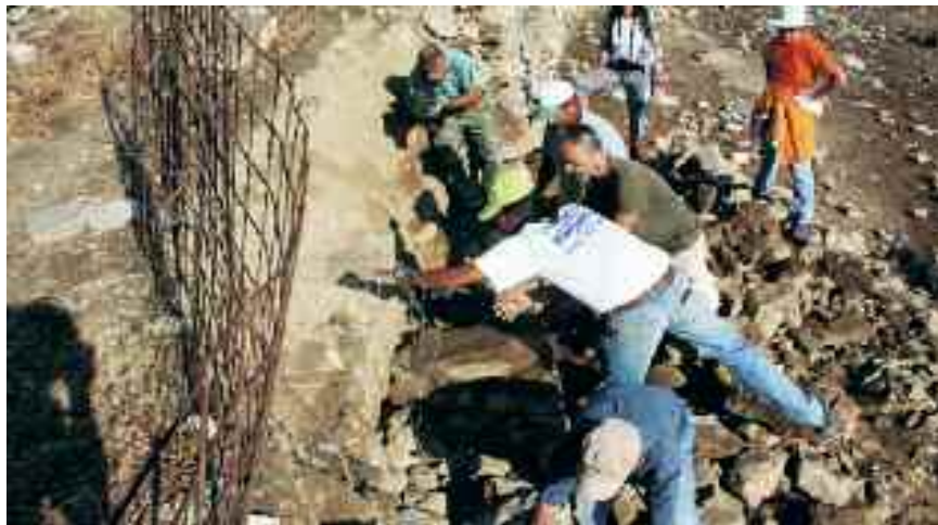
Εθελοντές και ντόπιοι μαστόροι αναστηλώνουν την πεσμένη Ξερολιθιά