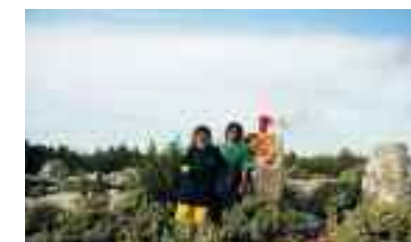
Αναβίωση των Φрукτωριών - άναμμα του «Πύργου της Μαύρης Σπηλιάς»

• Ο Σεπτέμβρης όμως δεν τελείωσε εκεί! Με πρωτοβουλία του Συμβουλίου Επικοινωνίας της ΕΛΜΕΤ, τη στήριξη του προγράμματος ΑΕΙΦΟΡΟ ΑΙΓΑΙΟ και τη συνεργασία ντόπιων μαστόρων της πέτρας αλλά και εθελοντών, αποκαταστάθηκε μέρος των πεσμένων ξερολιθιών στο