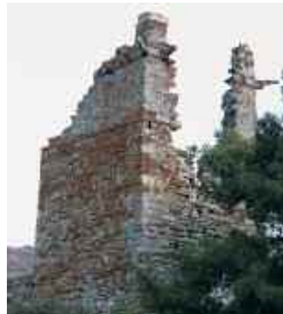
Ο Πύργος της Κέας πριν και μετά τις εργασίες στήριξης

Με επίμονες προσπάθειες του Συμβουλίου Αρχιτεκτονικής Κληρονομιάς της ΕΛΜΕΤ άνοιξε ο δρόμος για την αποκατάσταση του αρχαίου πύργου στην Αγία Μαρίνα Κέας. Ο εντυπωσιακός πύργος του 4ου π.Χ. αιώνας, με διαστάσεις πλευράς 9,90 μ. και ύψος 19,55 μ., είναι μνημείο μοναδικής αξίας, δεδομένου ότι αποτελεί το καλύτερο σωζόμενο παράδειγμα αυτόνομου ελεύθερου τετράγωνου πύργου της υστεροκλασσικής περιόδου, ενώ η θέση του, στο κέντρο μιας καλλιεργήσιμης κοιλάδας, του προσδίδει και έναν αγροτικό χαρακτήρα. Μέχρι τα μέσα του 19ου αι. το μνημείο σωζόταν ακέραιο, λόγω της ενσωμάτωσής του στον περίβολο της παρακείμενης μεταβυζαντινής μονής της Αγίας Μαρίνας. Ακόμα και σήμερα, σε ορισμένα σημεία ο πύργος σώζεται σχεδόν μέχρι το αρχικό του ύψος, όμως κατά τα τελευταία χρόνια τμήματά του κατέρρεαν. Με πρωτοβουλία της ΕΛΜΕΤ και με την συγκι-