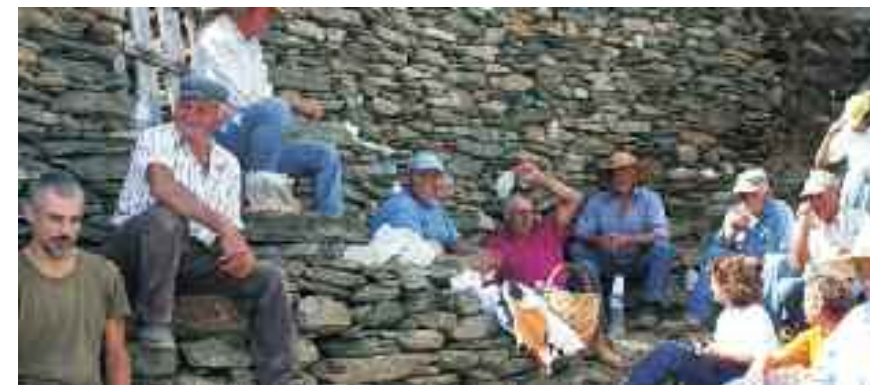
Ένα σύντομο διάλειμμα για την ομάδα της ΕΛΜΕΤ

Μας θύμισαν πόση σημασία έχει η εικόνα μας προς τα έξω, μετά από όσα έχουν συμβεί και γραφτεί για μας τον τελευταίο καιρό, και πόσο τέτοιες ενέργειες μαρτυρούν μια Ελλάδα που είναι ακόμα άραχη προς τα έξω, αλλά στο χέρι μας να αναδείξουμε ως αντιπροσωπευτική του δυναμικού μας.