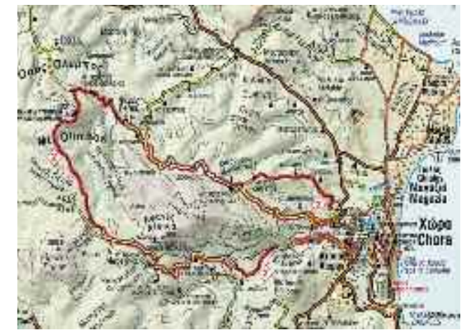
Χαρτογράφηση: Π. Ματσούκα, ANABASIS

τερικό του βουνού, στις πολυάριθμες χαράδρες και ρεματιές, με χαρακτηριστικότερα είδη τα σφενδάμια, τις αριές και τα φυλλίκια. Για περισσότερες πληροφορίες σχετικά με το Δίκτυο Μονοπατιών Σκύρου και την οικονομική ενίσχυση ολοκλήρωσής του, μπορείτε να επικοινωνείτε με: Δάφνη Μαυρογιώργου, Υπεύθυνη Περιβαλλοντικών Προγραμμάτων, 210 3225245 (εσωτ. 7), sfyp@ellinikietairia.gr