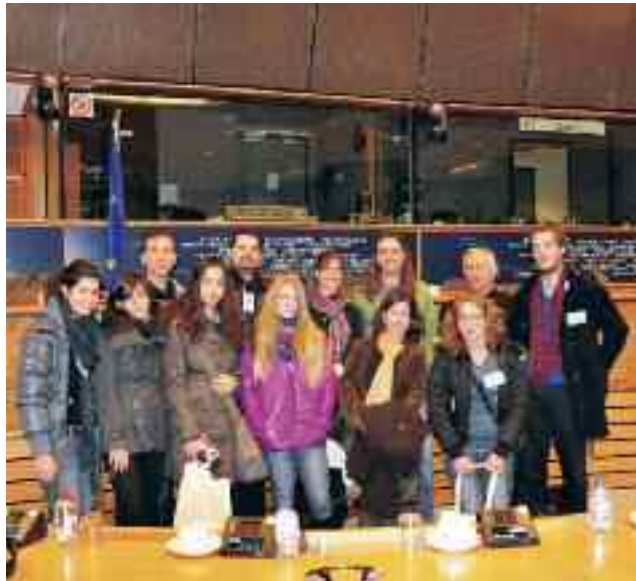
Καθηγητές και μαθητές του Γυμνασίου και Λυκείου Θήρας στο Ευρωπαϊκό Κοινοβούλιο, με τον Ευρωβουλευτή Κρίτωνα Αρσένη.

Για δεύτερη συνεχόμενη χρονιά, το Πρόγραμμα ΑΕΙΦΟΡΟ ΑΙΓΑΙΟ είχε την ευκαιρία να επιβραβεύσει τους μαθητές που διακρίθηκαν στις Δράσεις Ευαισθητοποίησης που υλοποιεί κάθε χρόνο στα νησιά του Αιγαίου, με μια εκπαιδευτική επίσκεψη στο Ευρωπαϊκό Κοινοβούλιο, έπειτα από την ευγενική πρόσκληση του Ευρωβουλευτή κ. Κρίτωνα Αρσένη.