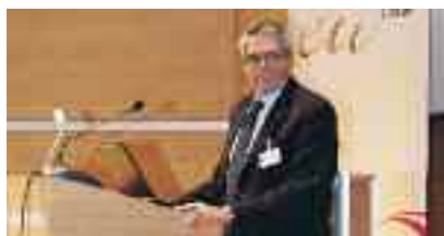
Γ. Παλαιοκρασάς, Αντιπρόεδρος ΕΛΜΕΤ

Οι πράσινοι φόροι ως λύση στην ελληνική και διεθνή κρίση ήταν το θέμα που ο Γιάννης Παλαιοκρασάς, Αντιπρόεδρος της ΕΛΛΗΝΙΚΗΣ ΕΤΑΙΡΕΙΑΣ Περιβάλλοντος & Πολιτισμού, Πρώην Υπουργός και Πρώην Επίτροπος Περιβάλλοντος Ε.Ε. παρουσίασε στο διεθνές συμπόσιο «Growth and green tax shifting in an era of fiscal consolidation» στις 15 και 16 Δεκεμβρίου 2010 στις Βρυξέλλες.