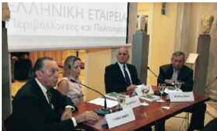
Από αριστερά: Γιάννης Μιχαήλ, Πρόεδρος ΕΛΛΗΝΙΚΗΣ ΕΤΑΙΡΕΙΑΣ Περιβάλλοντος & Πολιτισμού, Τίνα Μπιρμπίλη, Υπουργός Περιβάλλοντος, Ενέργειας και Κλιματικής Αλλαγής, Σταύρος Δήμας, τ. Επίτροπος Περιβάλλοντος Ε.Ε., Αντιπρόεδρος Νέας Δημοκρατίας και Στέφανος Μάνος, Πρόεδρος ΔΡΑΣΗΣ