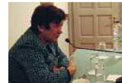
Μαργαρίτα Καραβασιλή, Ειδική Γραμματέας Επιθεώρησης Περιβάλλοντος και Ενέργειας

Η ομιλία της είχε ιδιαίτερη βαρύτητα διότι η Ειδική Γραμματέας έχει αποδείξει στην πράξη –με προσωπικές θυσίες– ότι η επιθεώρηση περιβάλλοντος αποτελεί λειτούργημα.