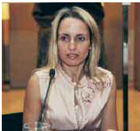
Τίνα Μπιρμπίλη, Υπουργός Περιβάλλοντος, Ενέργειας και Κλιματικής Αλλαγής