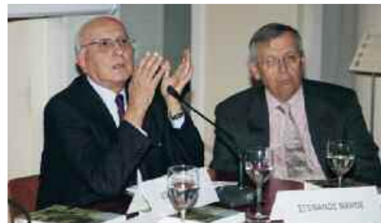
Σταύρος Δήμας, τ. Επίτροπος Περιβάλλοντος Ε.Ε., Αντιπρόεδρος Νέας Δημοκρατίας και Στέφανος Μάνος, Πρόεδρος ΔΡΑΣΗΣ